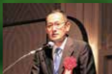
山中伸弥 京都大学 iPS細胞研究所所長 2012年 ノーベル生理学・医学賞を受賞