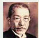
第7代大阪市長 せきはじめ 關一

当時の大阪市長 關一が「大学は都市とともにあり、都市は大学とともにある。」をモットーに掲げ、大阪市民の期待を背景に日本で最初の市立大学が誕生しました。