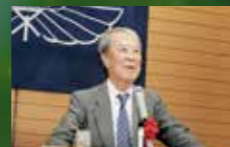
南部陽一郎 特別栄誉教授 2008年 ノーベル物理学賞を受賞

教員・卒業生 FACULTY & GRADUATES 世界に注目される研究で成果を上げた本学の教員や卒業生 彼らが残した功績は今も受け継がれています。