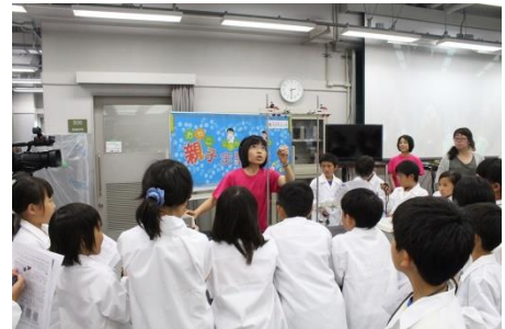
昨年の実験教室の様子

子どもたち、そして保護者の方にも「なにになに?」「どうなっているの?」と理科への興味を持っていただけるような実験を準備し、本学の技術職員が分かりやすく解説します。つきましては、広くご周知いただくとともに、ご取材をご検討いただきますよう、どうぞよろしくお願いたします。